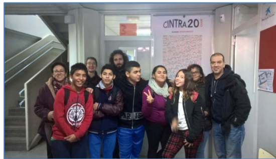
Una de les primeres sortides dels alumnes de 1r de l'ESO

El dia 24 d'octubre dues professionals de la Guàrdia Urbana van fer una xerrada sobre la violència de gènere a segon cicle d'ESO. Varen tractar els quatre tipus de violència de gènere que existeixen, tot posant diferents exercicis pràctics i varen resoldre diferents dubtes per part de l'alumnat.