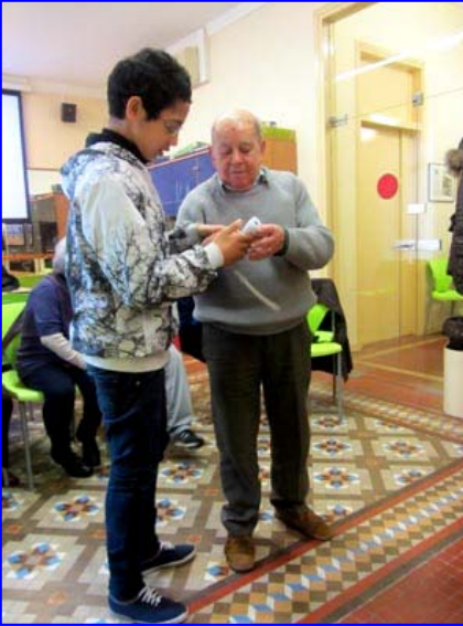
1er. de l'ESO amb els jubilats

Els alumnes de la Escola Cintra han dedicat un dia de la última setmana de febrer a "compartir experiències i temps" amb persones més desafavorides. Es tracta d'una iniciativa de l'Escola per fomentar en els alumnes l'observació de les realitats de pobresa del seu entorn i la solidaritat amb les persones en circumstàncies de feblesa personal o ambiental.