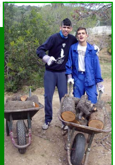
En l'hort de Benallar