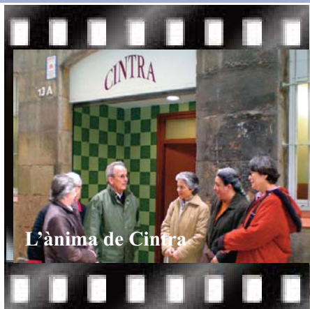
L'ànima de Cintra