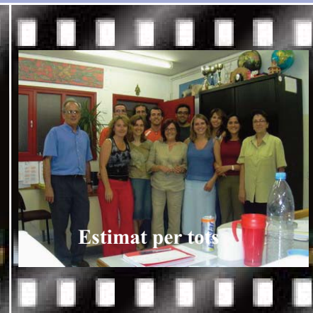
Estimat per tots