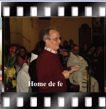
Home de fe